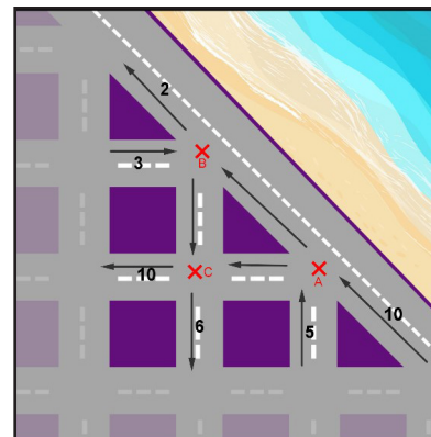
Figura 1. Representación del flujo vehicular

El Departamento Desarrollo Urbano del municipio desea conocer cómo se distribuyen los automóviles que circulan en el malecón de la ciudad, para determinar si existe capacidad de afluencia vehicular que permita transitar en el área que se analiza y si existen diferentes formas de distribución del tráfico. A partir de análisis viales previos, se han recolectado algunos datos históricos sobre la afluencia de automóviles en el área. Considerando los datos que se brindan, realiza los cálculos pertinentes de tal manera que des respuesta a las interrogantes que se plantean.